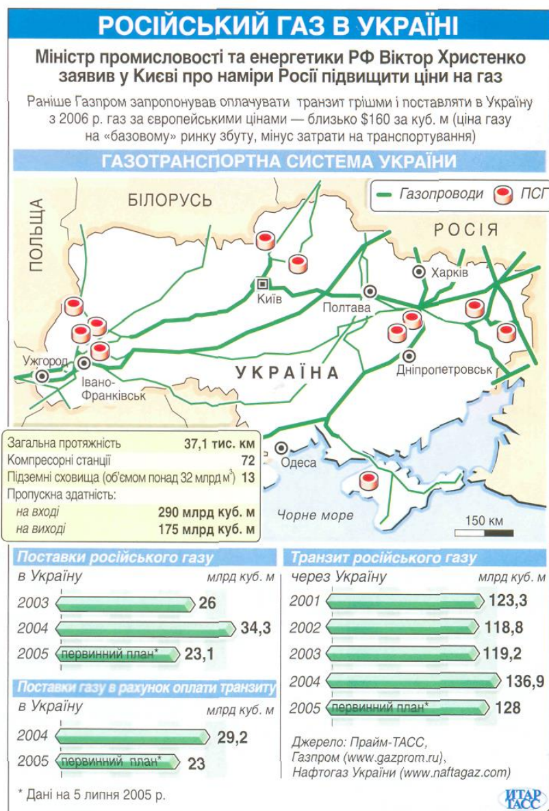
Рис. 4.5.1. Газотранспортна система України

Схоже, українці менше всіх переживають про те, де і за скільки вони купуватимуть газ найближчими роками. Правом хвилюватися про газове майбутнє України вони великодушно поступаються своїм партнерам — постачальникам газу, а саме: Росії і Туркменістану. Останні настільки емоційно сприймають необхідність підписувати угоди з Україною на постачання блакитного палива наступного року, що зопалу звинувачують Україну в чому завгодно, загрожують припиненням постачань газу у разі незговірливості українських лідерів і всілякими іншими способами «втрачають лице». Проте по цей бік українського кордону панує буддистська тиша і благодать. Всі напасти, про які міркують туркмени і росіяни, українці вважають не більше ніж примарними породженнями розуму своїх ділових партнерів і зберігають непорушний спокій (див.рис.4.5.1).